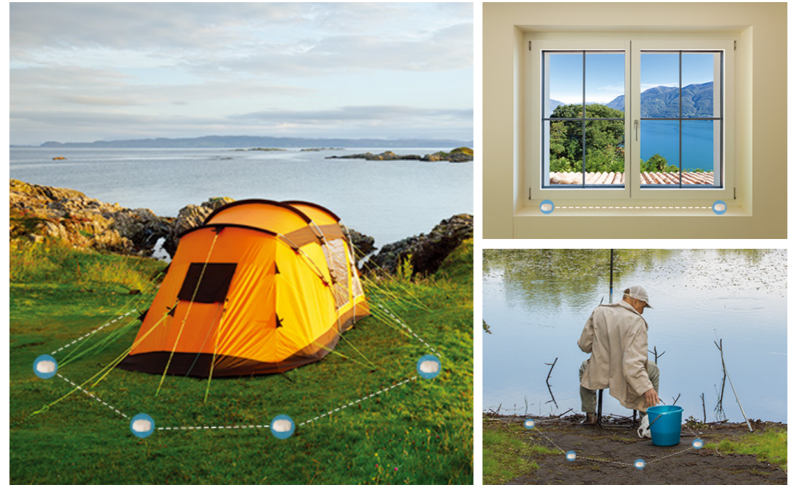
※ 보호하고자 하는 대상물 주변에 일정한 간격(30~50cm) 으로 설치하세요.